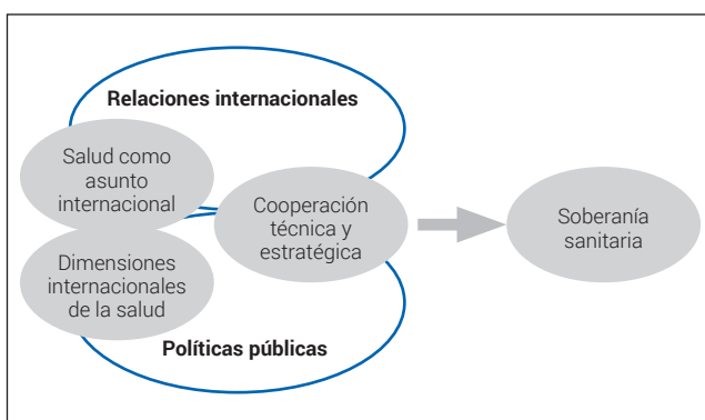
Figura 1. Forcejeos sobre una denominación del campo: salud mundial, salud internacional o salud global.

Hay una articulación estrecha entre Soberanía Sanitaria y la perspectiva de las SAI/DIS/CTE que intentamos graficar a continuación. La salud como asunto internacional opera como un recorte de las relaciones internacionales (RRII) y las dimensiones internacionales de la salud opera como un recorte de las políticas públicas. La cooperación técnica con perspectiva estratégica y emancipadora deconstruye prácticas y mecanismos de cooperación. Al mismo tiempo, la Soberanía Sanitaria deviene en un proveedor de sentido, un aporte direccional posible tanto individual como colectivo de las políticas de salud de nuestros países.