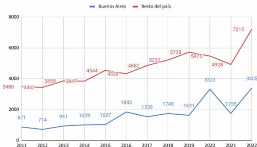
Cuadro 2. Egresados de la carrera de enfermería de la PBA vs. resto del país, 2011-2022

En este punto, cabe aclarar que la formación de auxiliares continúa, en especial en algunas instituciones privadas que se encuentran por fuera de la regulación del Estado y que, aunque no cuentan con la validez nacional que otorga el Ministerio de Educación, prosiguen ofreciendo esta formación.