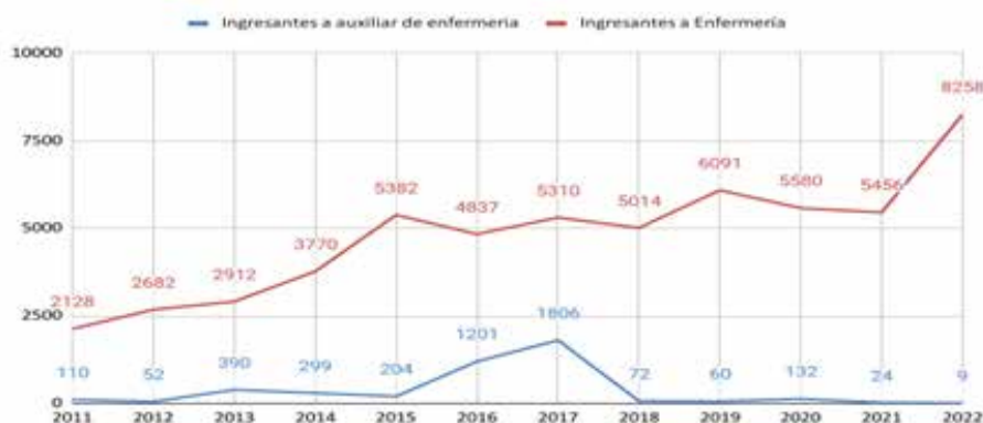
Cuadro 1. Ingresantes de enfermería según título. Provincia de Buenos Aires, 2011-2022

Fuente: Elaboración propia con base en datos proporcionados por la Dirección de Información Educativa – Ministerio de Educación de la Nación, 2022.